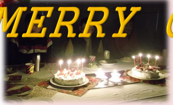
照明も凝ったゼイ！「夜って楽ね～」とのスタッフの声に大笑い