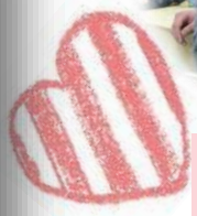
おいしい、早くケーキを仕上げようよ！